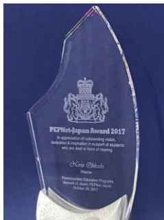
賞状の他に 記念品 も 授与されました。