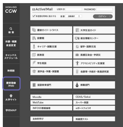
↑ CAMPUS GUIDE WEB トップページ