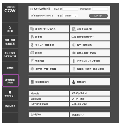
↑ CAMPUS GUIDE WEB トップページ