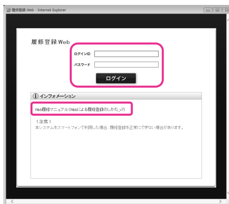
↑ 履修登録 Web ログイン画面