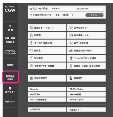
↑ CAMPUS GUIDE WEB トップページ