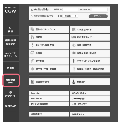
↑ CAMPUS GUIDE WEB トップページ