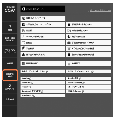
↑ CAMPUS GUIDE WEB トップページ