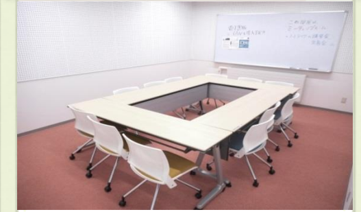
↑ ミーティングルーム