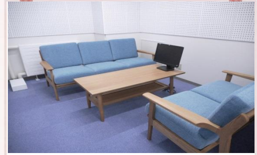
↑ 面談室 2